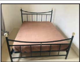
Vends Lit fer forgé 140 x 190 avec sommier. 40 euros. Tél. 07.85.52.76.68.