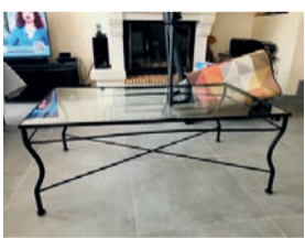
Vends Table verre et fer forgé, longueur 1,20m, largeur 70 cm, hauteur 46cm. 40 euros. Tél. 07.85.52.76.68.