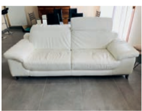
Vends Canapé blanc Cuir Center en très bon état. Longueur 2,10m largeur 1 m. Têtes mobiles hautes 98 cm. 350 euros. Tél. 07.85.52.76.68.

Dame 58 ans, aide-soignante, recherche un compagnon de 60 ans ou plus, pour partager une relation sérieuse et stable. J'aime la campagne, la nature, le jardinage, la marche, les randos mais aussi le cinéma, les sorties en famille et entre amis, la lecture. Les balades en montagne me ravissent mais j'apprécie aussi la mer, l'océan... Ecrire au Bulletin: RS 20-08/01.